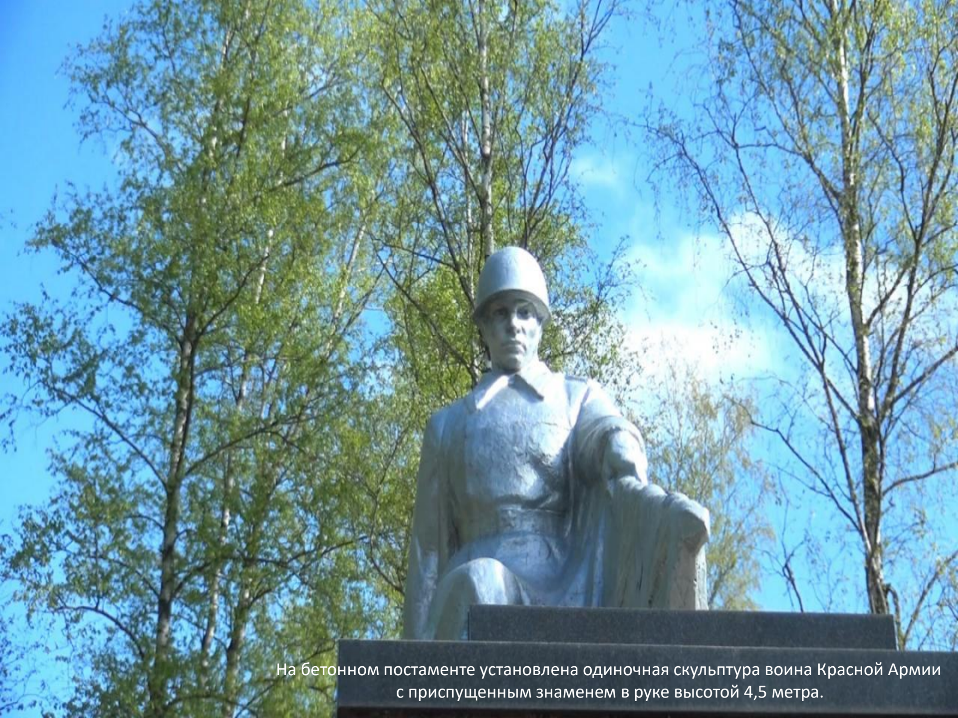
На бетонном постаменте установлена одиночная скульптура воина Красной Армии с приспущенным знаменем в руке высотой 4,5 метра.