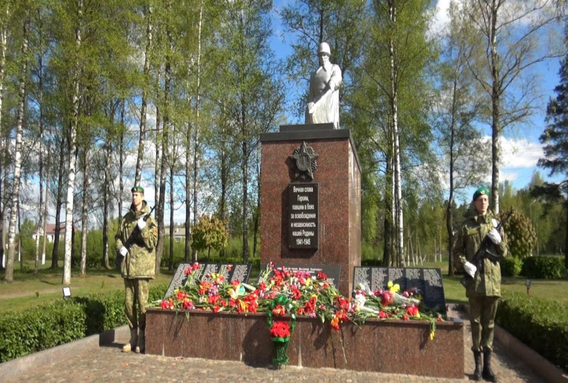
Братская могила советских воинов и партизан в городе Поставы